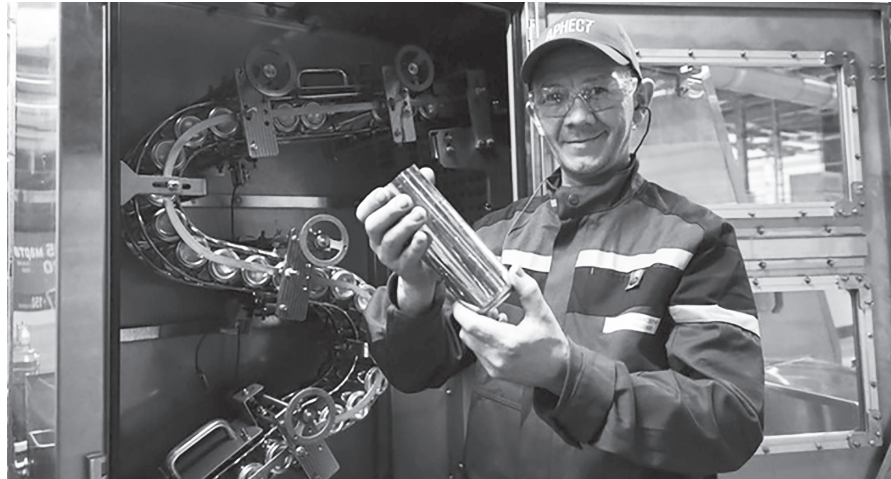
Самым объемным инвестпроектом, реализованным в Ульяновской области в 2024 году, стало открытие завода алюминиевой упаковки компании «Арнест Упаковочные Решения». Общий объем вложений превысил 13,5 миллиарда рублей, строительство здания и монтаж оборудования завершили в течение года, первую линию запустили 15 марта, вторую - летом, после чего предприятие выпускает 1,6 миллиарда банок в год, что на сегодня полностью закрыло потребности российского рынка.